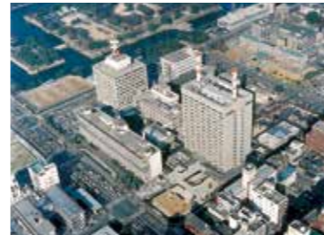
▲広島地方合同庁舎

9月10日 広島地方合同庁舎4号館完成 12月4日 山陽自動車道防府東I.C～山口JCT開通