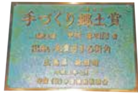
▲手づくり郷土賞記念銘板