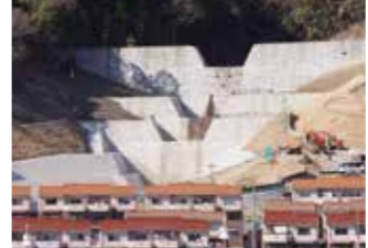
▲上山川溪流砂防堰堤 (広島市安佐南区八木3丁目)