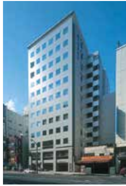
▲本部移転(第一生命ビル)