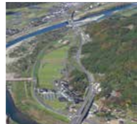
▲鳥取自動車道開通

1月30日 一般国道53号(鳥取市国安字下河原～鳥取市叶字三牧)の4車線化完了 3月14日 鳥取自動車道(中国横断自動車道姫路鳥取線)(智頭I.C～河原I.C)開通 3月29日 一般国道185号安芸津バイパス部分開通 7月10日 一般国道29号、53号吉成交差点立体化供用開始 7月21日 山口県防府市土石流災害発生 11月28日 山陰自動車道(斐川I.C～出雲I.C)が開通