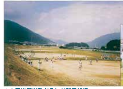
▲太田川河川敷グランド利用状況