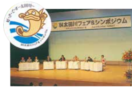
▲太田川フェア&シンポジウム