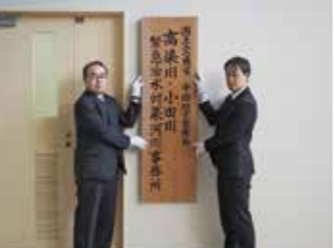
▲4月15日 高梁川・小田川緊急治水対策河川事務所開所

6月 事業監理業務着手 (高梁川・小田川) 10月 「こうじ君のなぜなぜ豆辞典」テレビ放送 11月 事業監理業務着手 (玉島・笠岡道路・笠岡BP)