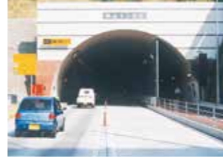
▲分離壁が完成した休山トンネル

7月 みらいビジョン中国21「2004」策定 8月27日 国道185号休山トンネル歩道分離壁完成 10月16日 江島大橋開通