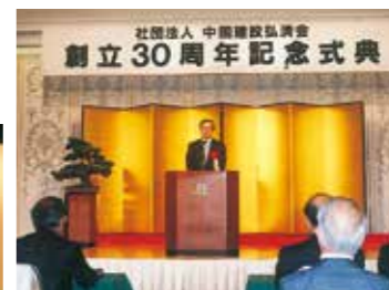
▲創立30周年記念式典