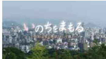
▲いのちをまもる～土砂災害の教訓、そして備え～ (テレビ放送)