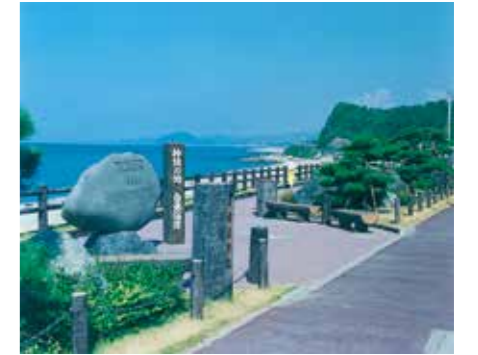
▲白兎歩道の環境整備