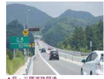
▲萩・三隅道路開通

1月23日 一般国道2号厚狭増生バイパス開通 3月25日 一般国道191号(山陰自動車道)萩・三隅道路開通 9月29日 山陰自動車道(名和・淀江道路)開通 10月31日 一般国道2号三原バイパス時広ランプ供用開始 11月3日 東広島・呉自動車道(馬木I.C～上三永I.C)開通 11月11日 砂川改修(百間川改修事業)完了 12月2日 一般国道9号出雲バイパス開通 12月2日 一般国道54号可部駅西口広場完成