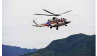
▲中国整備局 (6月19日) 災害対策用ヘリコプター「おりづる号」就航

4月 事業監理業務着手 (益田西道路外) 事業監理業務着手 (藤生長野BP・国土強靱化 (防災・橋梁保全)) 7月 事業監理業務着手 (松江国道電線共同溝) 10月 「こうじ君のなぜなぜ豆辞典」テレビ放送 11月 中国「道の駅」連絡会の事務局業務を開始