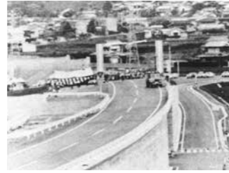
▲国道2号尾道バイパス開通