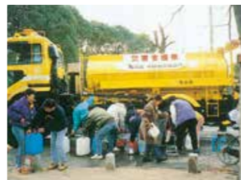
▲阪神淡路大震災被災地への給水支援