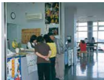
▲ゆうひパーク浜田の道路情報提供