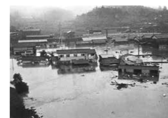
▲昭和47年7月豪雨災害、三次市の状況