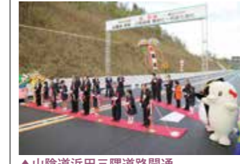
▲山陰道浜田三隅道路開通

2月4日 太田川放水路完成50周年記念シンポジウム 3月18日 山陰道朝山・大田道路6.3km開通