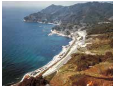
▲国道191号山口県阿武町