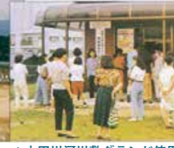
▲太田川河川敷グランド使用情報センター