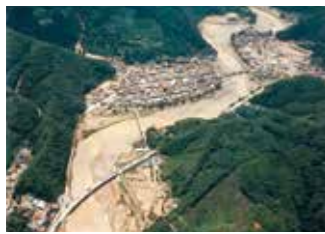
▲島根県三隅町の被災状況

3月 国道2号岡山バイパス大高高架完成 6月 百間川暫定通水断面概成 7月23日 島根県西部集中豪雨災害 8月23日 国道2号周南バイパス全線開通 10月 太田川基町環境護岸整備完成 11月2日 国道54号相生橋架替工事完成 12月16日 国道54号巴橋完成