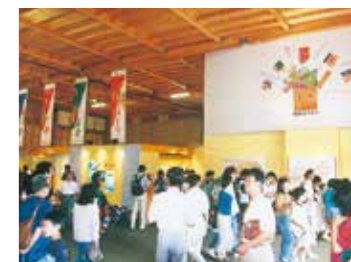
▲山陰・夢みなど博覧会