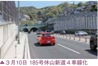
▲3月10日 185号休山新道4車線化

3月19日 東広島呉自動車道阿賀I.C立体化完成 5月29日 大山砂防白水仙 (二の沢) 砂防堰堤 (385m) 完成 7月25日 江の川水系江の川等、特定都市河川に指定される 10月27日 一般国道9号出雲バイパス (中野東交差点～姫原東交差点) 4車線化完成 11月2日 一級河川吉井川「和気町かわまちづくり」完成 11月13日 山陰自動車道益田西道路杭打式