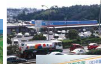
▲佐方サービスエリア道路案内所