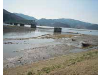
▲東日本大震災災害支援