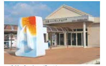
▲今津パーキングエリア

5月27日 水防演習(太田川)に協賛(以降継続) 8月 道路財源キャンペーン及び道路利用PRに協力 ●斐伊川他の河川敷にベンチ及び屑入れを設置 ●国道185号沿道に擬木柵、ベンチを設置