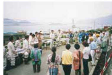
▲用地調査技術業務