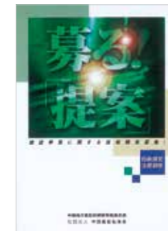
▲技術開発支援制度