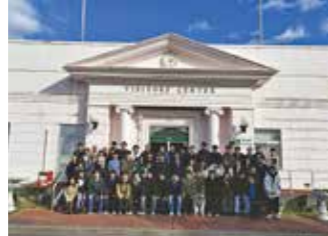
▲中国地方地域づくり学生フォーラム in 周防大島

3月 東広島・安芸バイパス関連特番「国道2号行ってみた」テレビ放送 8月 中国「道の駅」連絡会総会 in 笠岡 10月 「こうじ君のなぜなぜ豆辞典」テレビ放送 11月1日 本部移転 広島市西区中広町三丁目25番15号