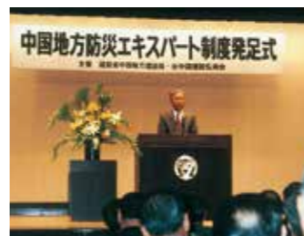
▲防災エキスパート制度発足