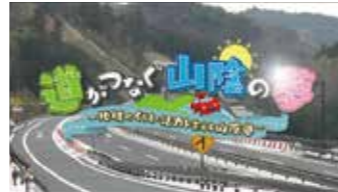
▲道がつなぐ山陰の夢 (テレビ放送)