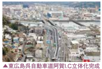
▲東広島呉自動車道阿賀I.C立体化完成

5月1日 新元号「令和」 9月9日 台風15号による強風被害、住宅被害約75,000戸、千葉県等で大規模停電、最大935,000戸 10月1日 消費税10%に増税実施 10月12日 台風19号による記録的大雨、関東、甲信越、東北の各所で堤防決壊、河川氾濫等、死者・行方不明88人 10月25日 低気圧による大雨で千葉、福島等で土砂災害、浸水等。死者13人