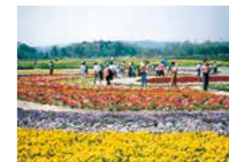
▲国営備北丘陵公園部分開園