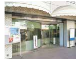
▲本部移転(メゾン京口門)