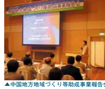
▲中国地方地域づくり等助成事業報告会

1月21日 ISO9001取得 3月4日 鳥取支部事務所移転(倉吉市海田西町2丁目183) 5月3日～5日 「フラワーフェスティバル」PRで地整と共催 6月2日 「森と川と海のフォーラム」に地整と共催 7月27日～28日 「森と湖に親しむ旬間」森と弥栄湖フェスタに協賛 8月 「第3回世界水の文化館フォーラム」に共催 11月25日 広島支部事務所移転(広島市西区中広町3丁目25-8) ●「中国地方地域づくり助成制度」創設