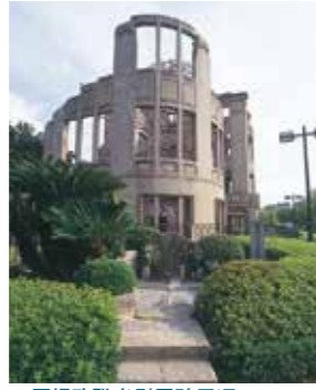
▲原爆殉職者慰霊碑周辺