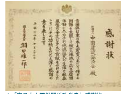
▲「東日本大震災関係功労者」感謝状