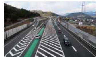
▲一般国道2号東広島・安芸バイパス全線開通

1月29日 一般国道180号総社・一宮バイパス(1.9km)一部開通 2月23日 一般国道2号大橋橋西交差点立体工事完成 3月19日 一般国道2号東広島・安芸バイパス全線開通(八本松西I.C～瀬野西I.C 8.4km、海田東I.C～海田西I.C 1.6km)