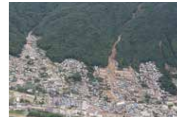
▲広島土砂災害 8月20日

「こうじ君のなぜなぜ豆辞典」テレビ放送開始 9月6日 中国地方の地域社会を考えるシンポジウム後援