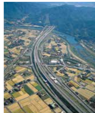
▲山陽自動車道徳山西I.C～防府東I.C開通

3月27日 山陽自動車道徳山西I.C～防府東I.C開通 4月7日 斐伊川・神戸川総合開発工事事務所設置、志津見ダム建設事業着手 9月8日 羅漢山雨量レーダー開所