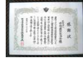
▲山古志村からの感謝状