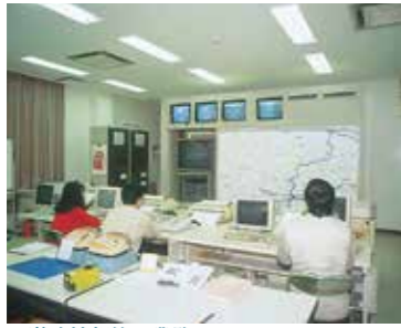
▲道路情報管理業務