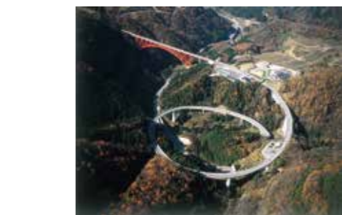
▲奥出雲おろちループ