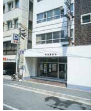
▲本部移転(明文堂ビル)