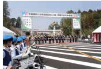
▲中国横断自動車道尾道松江線全線開通