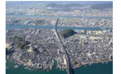
▲一般国道2号広島南道路開通