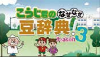
▲「こうじ君のなぜなぜ豆辞典」 (テレビ放送)

6月 事業監理業務着手 (高梁川・小田川) 10月 「こうじ君のなぜなぜ豆辞典」テレビ放送 11月 事業監理業務着手 (玉島・笠岡道路・笠岡BP)