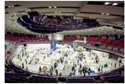
▲協賛事業の一つ、国土建設フェア