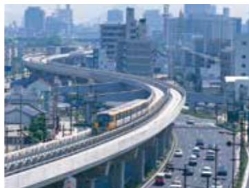
▲祇園新道、新交通システム開通