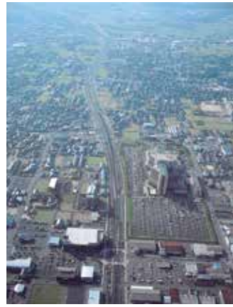
▲出雲バイパス開通