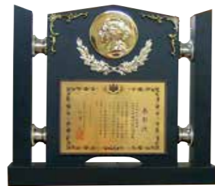
▲土木材料試験業務による表彰盾