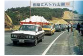
▲岡山バイパス初開通