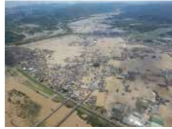
▲西日本豪雨災害 (倉敷市真備地区)