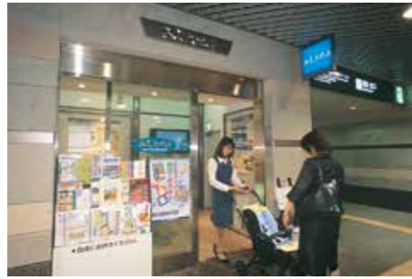
▲紙屋町地下街「みちスポット」