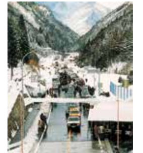
▲志戸坂トンネル開通