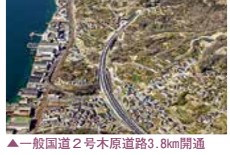
▲一般国道2号木原道路3.8km開通