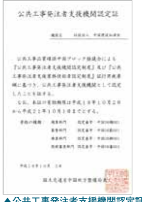
▲公共工事発注者支援機関認定証

7月 「しまなみ海道」開通記念イベント後援 8月 「旭川清流ワークショップ」に共催 8月28日 「けんせつ青空教室」主催 9月4日 「アスワーク宣言」後援 9月9日 「砂防フォーラム in 鳥取」共催 10月25日 中国建設弘済会事務所移転(広島市中区八丁堀14-4 広島八丁堀第一生命ビルディング3・4F)