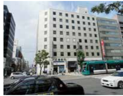
▲本部移転 (セントラルビル)