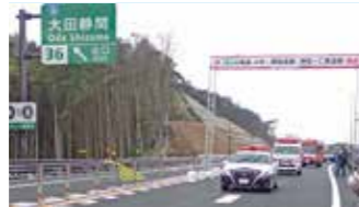
▲山陰道 大田・静間道路、静間・仁摩道路開通

1月5日 中国地方整備局から北陸地方整備局にTEC-FORCE派遣 3月9日 山陰道 大田・静間道路、静間・仁摩道路開通