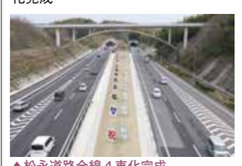
▲松永道路全線4車化完成