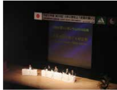
▲第28回土砂災害「全国の集い」