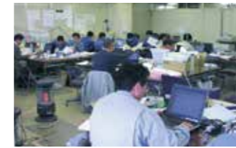
▲新潟県中越地震災害復旧支援状況