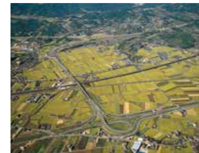
▲山陽自動車道玉島I.C付近

3月1日 山陽自動車道早島I.C～福山東I.C開通 3月23日 国道54号祇園新道全線暫定供用 3月 河川環境管理基本計画策定 4月11日 灰塚ダム建設事業着手 10月3日～5日 広島市で土木学会全国大会開催 11月22日 国道2号防府バイパス全線開通