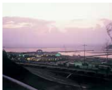
▲道の駅ゆうひパーク浜田