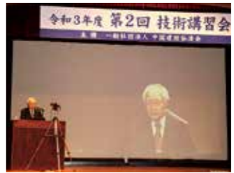
▲元中国地方整備局長 近藤徹氏講話

4月 事業監理業務着手 (益田西道路外) 事業監理業務着手 (藤生長野BP・国土強靱化 (防災・橋梁保全)) 7月 事業監理業務着手 (松江国道電線共同溝) 10月 「こうじ君のなぜなぜ豆辞典」テレビ放送 11月 中国「道の駅」連絡会の事務局業務を開始