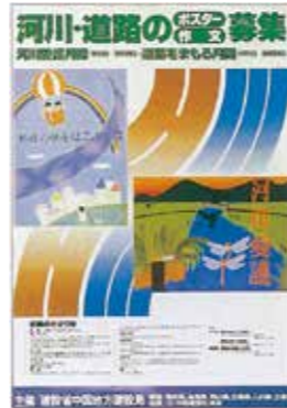
▲河川・道路の作文・ポスター募集